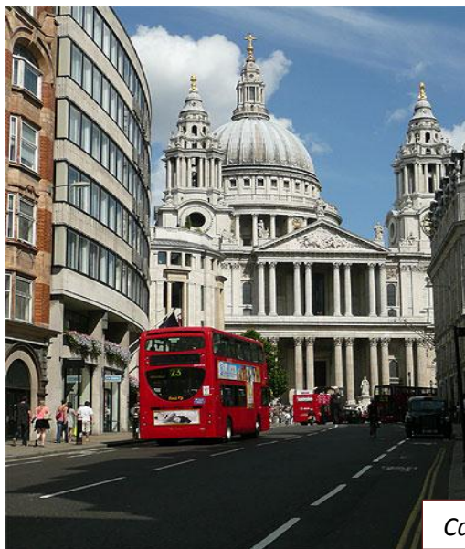
Cathédrale St Paul