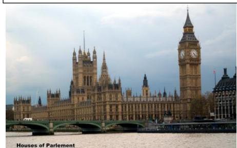
Houses of Parliament