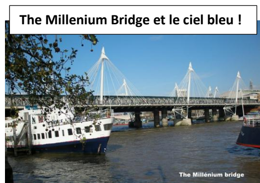
The Millenium Bridge et le ciel bleu !

4 Jours dans cette capitale : Pas suffisant bien sûr à moins d'être marathonien mais bon au matin du 12 avril tout le monde était là et à l'heure.