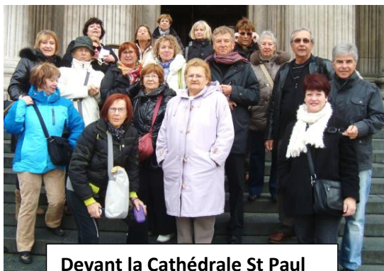
Devant la Cathédrale St Paul